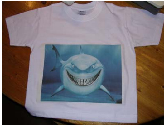
Het eind resultaat na het strijken