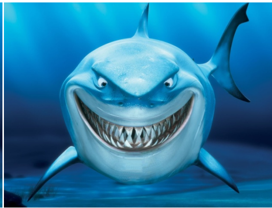
Hier haben wir die Fische weggenommen