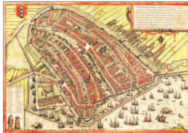
De Amsterdamse samenleving was al in de 17e eeuw inclusive , gericht op gelijkheid en individuele vrijheid. De Amsterdamse instituties werden getransplanteerd naar Nieuw-Nederland, wat nu New York is.

Aruba heeft een meer inclusive economie. De bevolking profiteert meer van de economische groei. Het pensioen, minimumloon en uitkeringen liggen hoger dan op Curaçao en er is een algemene ziektekostenverzekering. Politici hebben hun eigen arbeidsvoorwaarden teruggebracht. En natuurlijk heeft Aru-