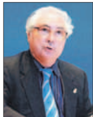
De netwerksamenleving, aangedreven door het internet, is beschreven door Manuel Castells, een van de meest invloedrijke sociologen van deze tijd.